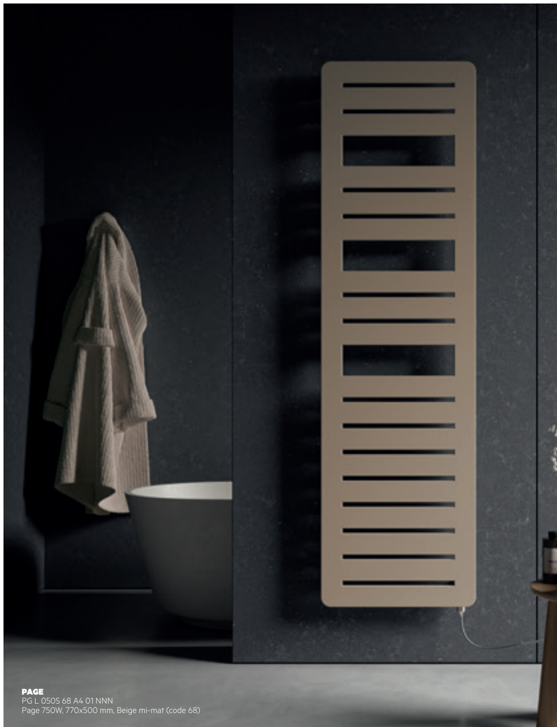
PAGE PG L 050S 68 A4 01 NNN Page 750W, 770x500 mm, Beige mi-mat (code 68)